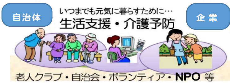
図 厚生労働省老健局振興課から発行されている資料より

資料：1995～2015年：国勢調査、2020年以降：「日本の将来推計人口（平成29年推計）」（出生中位・死亡中位推計）。国立社会保障・人口問題研究所