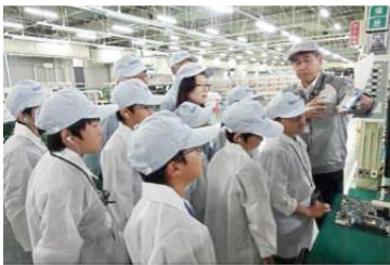
IT企業の製造現場の見学

H29年度は団員9名(小学生7名、中学生2名)が入団、5月21日に入団式、活動前半はパソコンの基本学習、楽しいプログラム作り体験や日立製作所大みか事業所見学などを実施した。後半は「情報検定(J検)」講習会を実施し、情報検定(J検)試験に挑戦して団員9名全員が受験、5名が見事「J検3級」に合格した。