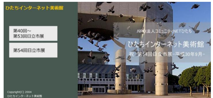
ホームページ「ひたちインターネット美術館」

第54回日立市美術展覧会が日立シビックセンター、マーブルホールで開催された。各部門からの作品77点の申し込みがあり掲載した。第40回の市展からの掲載作品数は約1,400点が収録され、