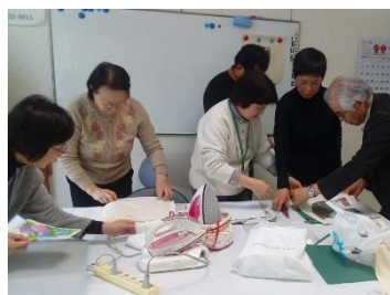
54回パソコンを楽しむ会 —アイロンプリントを使ったエコバッグづくり—

2009年に始まり本年11月で58回の開催となった。担当は「なでしこCnet」の8名の女性講師陣。