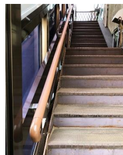
安全のために入口階段に新設された手すり (1/31)