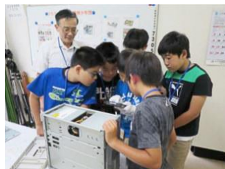
パソコンの解体組立作業