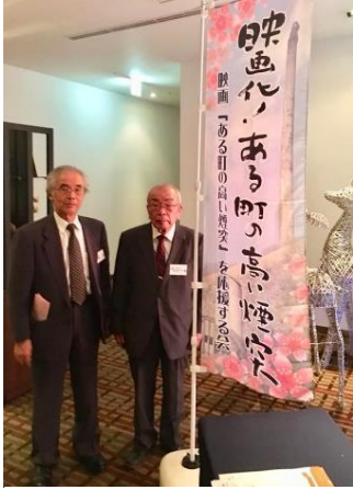
ホテルテラスザガーデン 水戸で協賛金募集活動 (計算制御会で)

主催で、平成31年2月2日（土）に日立市民会館と共楽館（現日立武道館）で、協賛をいただいた方々を対象に、先行して映画館上映されることになった。