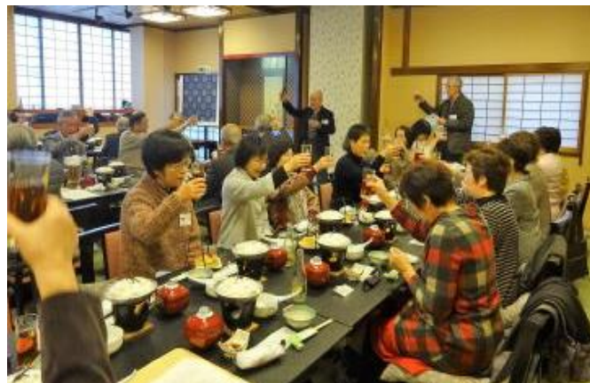
忘年会で女性も多く出席して、乾杯！！

会員から寄贈されたコーヒーマーカー。もう一つ事務室にもあり、カフェシネットでの懇談に利用しています。有難うございました。