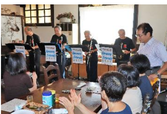
ハーモニーフレンズ