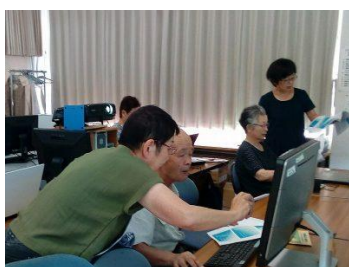
56回パソコンを楽しむ会 —暑中お見舞い葉書の作成—