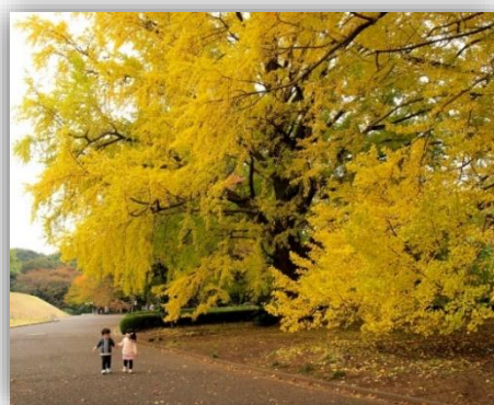
宮原養治 作品『仲良し』 (公財)日立市民科学文化財団理事長賞

6月10日撮影会は鎌倉の長谷寺や円覚寺を散策した。秋は浅草、東京スカイツリーなどを巡るはとバスを利用して撮影会を開催した。日立市展では会員10人が作品を出展し次の作品ほか2点が入賞した。