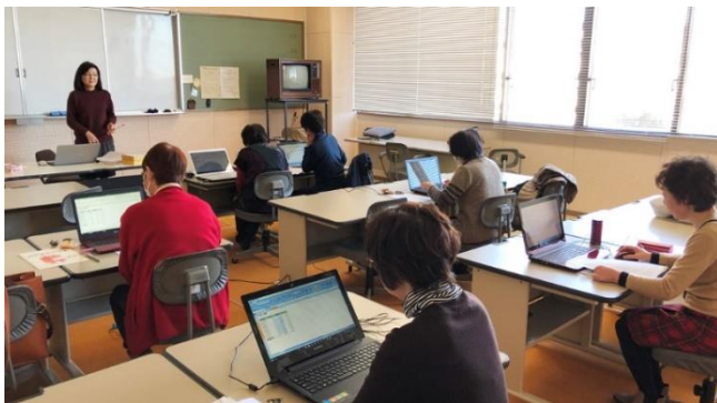
多賀図書館第4研修室にて

2017年12月現在は、11の自主グループ、約40名が利用している。また、ひたちパソコン探検少年団もここを拠点に活動をしている。