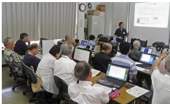
第47回「Bluetoothの最新動向活用事例」の講座