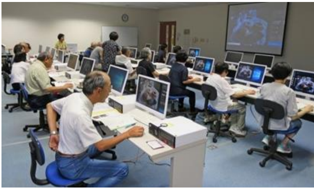
県北生涯学習センターパソコン講座風景