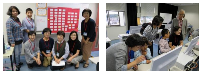
県北生涯学習センターで 県北フェスティバルに参加したメンバーと活動状況

「Cnetなでしこグループ」の皆さんが中心となり、「パソコンで、自分だけの名刺作り」を実施した。会場の3階パソコン室への参加者は、終了間際まで途絶えることなく続き、大変よい地域貢献活動ができた。